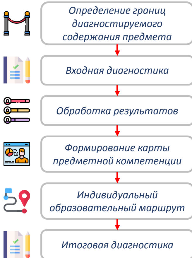
Схема работы проекта